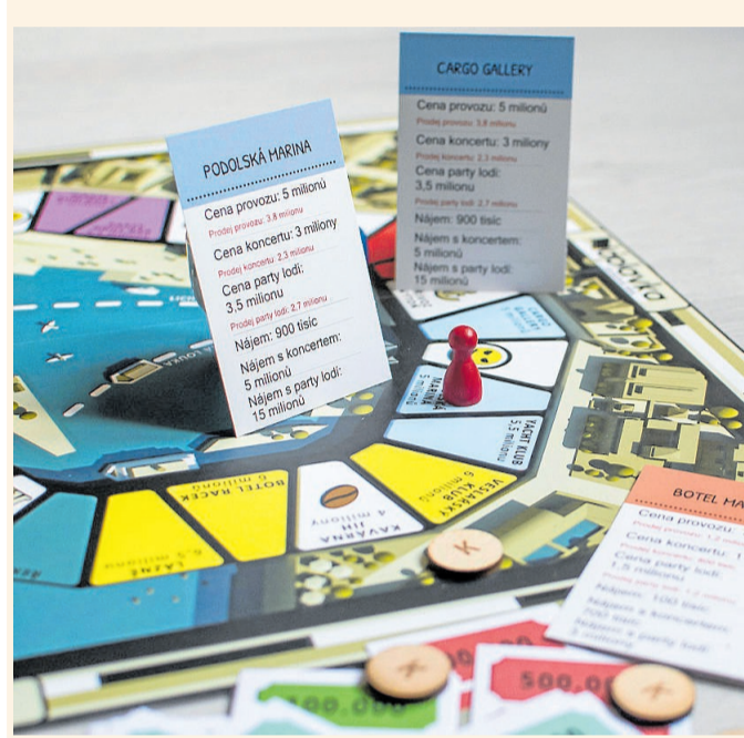
OTEVŘETE si bar nebo kavárnu na oblíbeném místě Prahy.